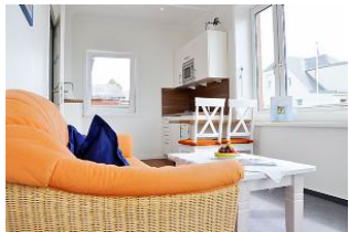
Das gemütliche Wohnzimmer.

Großzügiges und komfortables Hotel - Appartement ( Suite ), Wohnzimmer mit Süd - Balkon und Meerblick, kl. Küche, 2 Schlafzimmer, Bad. Genießen Sie den einmaligen Blick nach Süden auf die Nordsee und die Halligen. Bitte beachten Sie unsere Sonder - Arrangements.