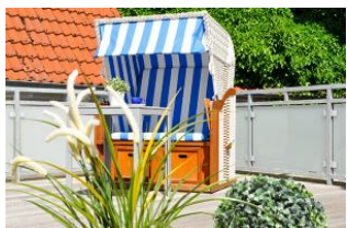
Dachterrasse mit Strandkorb und Meerblick