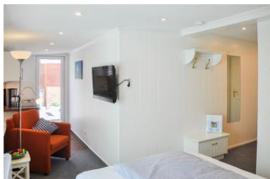
Das komfortable Appartement mit großer Dachterrasse