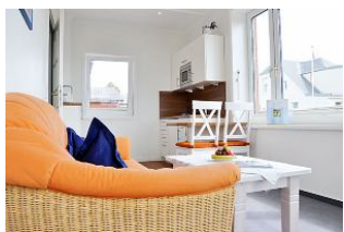
Das gemütliche Wohnzimmer.

Großzügiges und komfortables Hotel - Appartement ( Suite ), Wohnzimmer mit Süd - Balkon und Meerblick, kl. Küche, 2 Schlafzimmer, Bad. Genießen Sie den einmaligen Blick nach Süden auf die Nordsee und die Halligen. Bitte beachten Sie unsere Sonder - Arrangements.