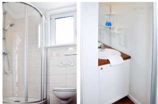
... und noch einen Blick ins Badezimmer.