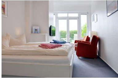
Das gemütliche Doppelzimmer mit Blick nach Süden in den großen Garten.