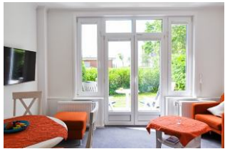
Das gemütliche Wohnzimmer mit Süd - Terrasse in den großen Garten.

Großzügiges und komfortables Hotel - Appartement ( Suite ), Wohnzimmer mit kl. Küche und Süd - Terrasse mit Meerblick, Schlafzimmer, Bad.