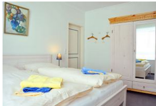
Das kuschelige Schlafzimmer.