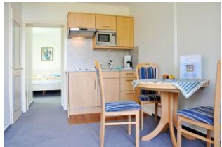
... essen mit Meerblick ...

Großzügiges und komfortables Hotel - Appartement ( Suite ), Wohnzimmer mit kl. Küche, Süd - Balkon und Meerblick, Schlafzimmer, Bad. Genießen Sie den einmaligen Blick nach Süden auf die Nordsee und die Halligen. Bitte beachten Sie unsere Sonder - Arrangements.