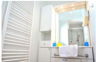
Ein Blick ins Badezimmer . . . .