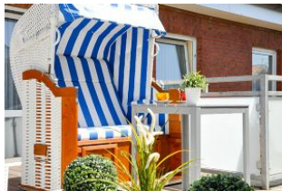
Eigener Strandkorb auf der Dachterrasse