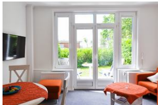
Das gemütliche Wohnzimmer mit Süd - Terrasse in den großen Garten.

Großzügiges und komfortables Hotel - Appartement ( Suite ), Wohnzimmer mit kl. Küche und Süd - Terrasse mit Meerblick, Schlafzimmer, Bad.