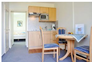
... essen mit Meerblick ...

Großzügiges und komfortables Hotel - Appartement ( Suite ), Wohnzimmer mit kl. Küche, Süd - Balkon und Meerblick, Schlafzimmer, Bad. Genießen Sie den einmaligen Blick nach Süden auf die Nordsee und die Halligen. Bitte beachten Sie unsere Sonder - Arrangements.