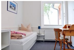
... noch?n Schlafzimmer