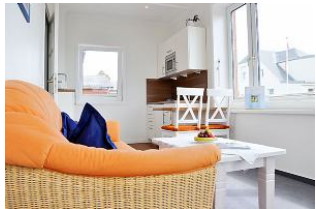
Das gemütliche Wohnzimmer.

Großzügiges und komfortables Hotel - Appartement ( Suite ), Wohnzimmer mit Süd - Balkon und Meerblick, kl. Küche, 2 Schlafzimmer, Bad. Genießen Sie den einmaligen Blick nach Süden auf die Nordsee und die Halligen. Bitte beachten Sie unsere Sonder - Arrangements.