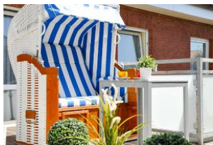
Eigener Strandkorb auf der Dachterrasse