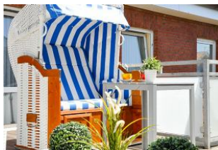
Eigener Strandkorb auf der Dachterrasse