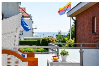
Dachterrasse mit Meerblick