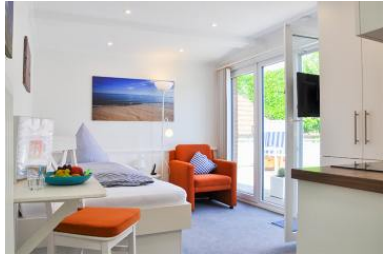
Das gemütliche Appartement mit großer Dachterrasse.