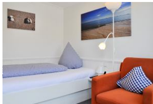
Schlafen im großen Einzelbett