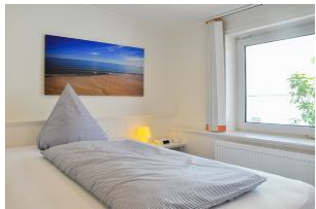
Schlafen im Französischen Bett

Schönes und komfortables Einzel - Appartement ( Junior - Suite ) mit franz. Bett, kl. Küche und großer Dachterrasse mit Strandkorb und Meerblick !