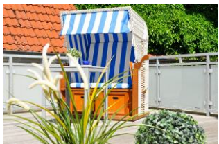
Dachterrasse mit Strandkorb und Meerblick