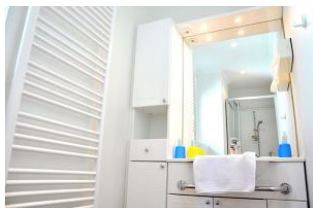
Ein Blick ins Badezimmer . . . .