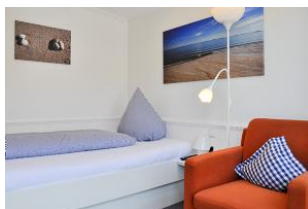
Schlafen im großen Einzelbett