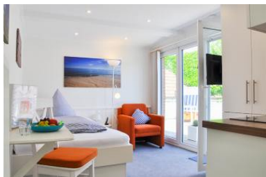
Das gemütliche Appartement mit großer Dachterrasse.