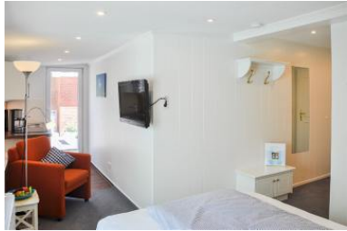
Das komfortable Appartement mit großer Dachterrasse