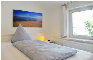
Schlafen im Französischen Bett

Schönes und komfortables Einzel - Appartement ( Junior - Suite ) mit franz. Bett, kl. Küche und großer Dachterrasse mit Strandkorb und Meerblick !