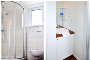
... und noch einen Blick ins Badezimmer.