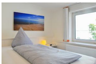
Schlafen im Französischen Bett

Schönes und komfortables Einzel - Appartement ( Junior - Suite ) mit franz. Bett, kl. Küche und großer Dachterrasse mit Strandkorb und Meerblick !