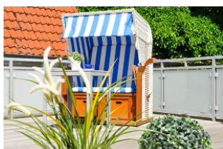
Dachterrasse mit Strandkorb und Meerblick