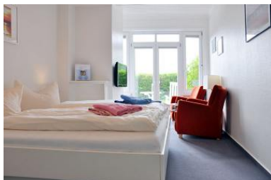
Das gemütliche Doppelzimmer mit Blick nach Süden in den großen Garten.